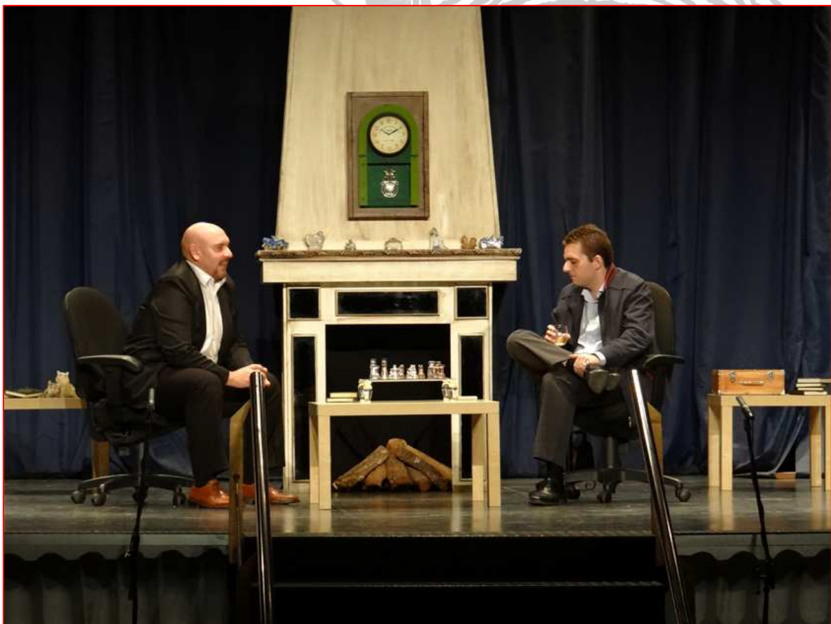
Un momento de la representación, donde se puede observar el decorado

(En el caso de que en el lugar de la representación no se contase con un equipo de sonido, el grupo dispone del suyo, compuesto de mesa de mezcla de 10 cortes, ordenador portátil, y altavoces profesionales ).