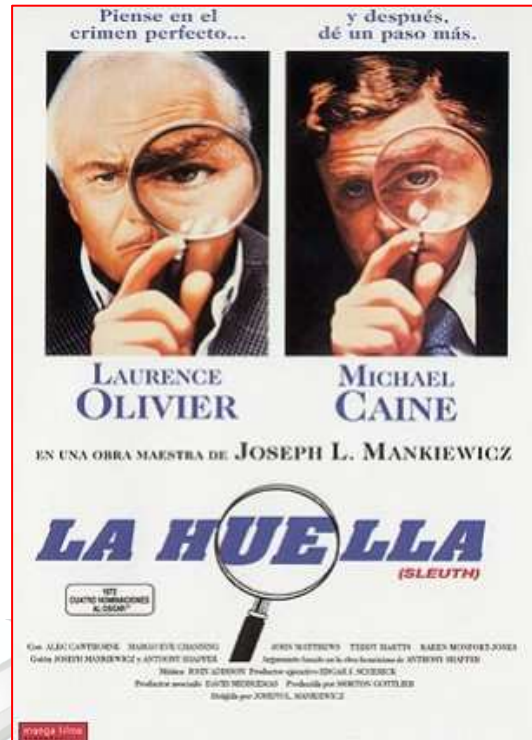
Versiones cinematográficas de la obra