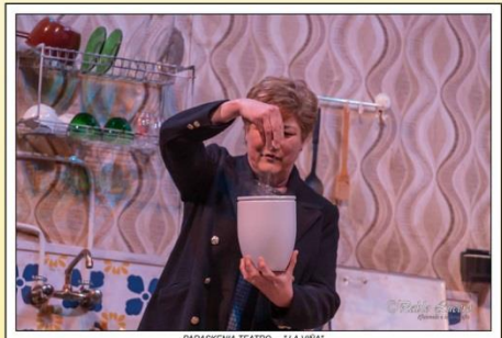
PARASKENIA TEATRO - "LA VIÑA" Teatro Victoria - Talavera de la Reina 12-04-2019