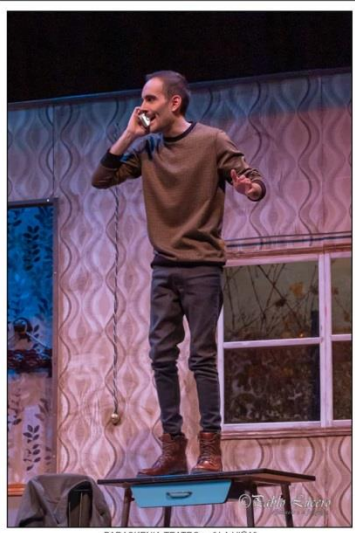
PARASKENIA TEATRO - "LA VIÑA" Teatro Victoria - Talavera de la Reina 12-04-2019