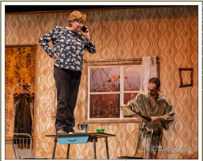
PARASKENIA TEATRO - "LA VIÑA" Teatro Victoria - Talavera de la Reina 12-04-2019