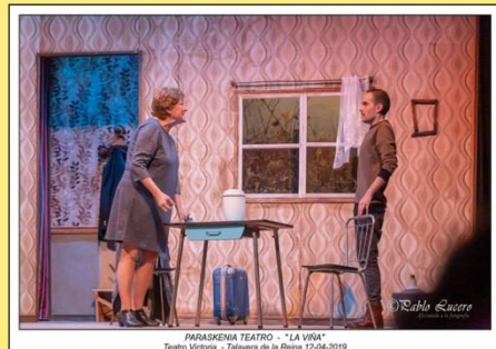
PARASKENIA TEATRO - "LA VIÑA" Teatro Victoria - Talavera de la Reina 12-04-2019