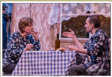
PARASKENIA TEATRO - "LA VIÑA" Teatro Victoria - Talavera de la Reina 12-04-2019