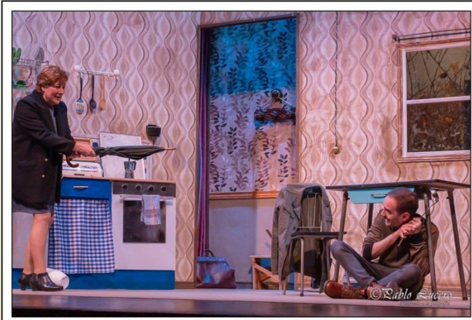
PARASKENIA TEATRO - "LA VIÑA" Teatro Victoria - Talavera de la Reina 12-04-2019