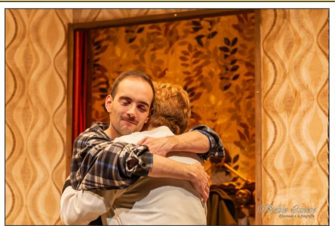
PARASKENIA TEATRO - "LA VIÑA" Teatro Victoria - Talavera de la Reina 12-04-2019