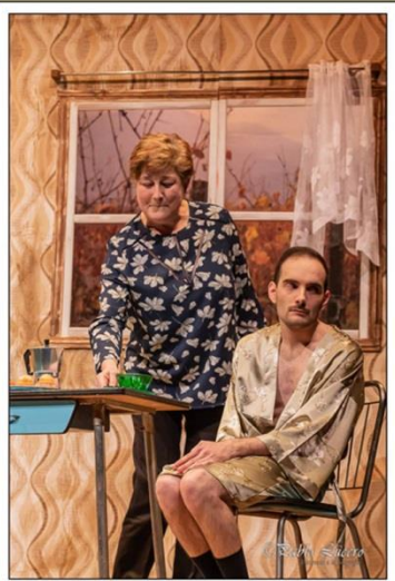
PARASKENIA TEATRO - "LA VIÑA" Teatro Victoria - Talavera de la Reina 12-04-2019