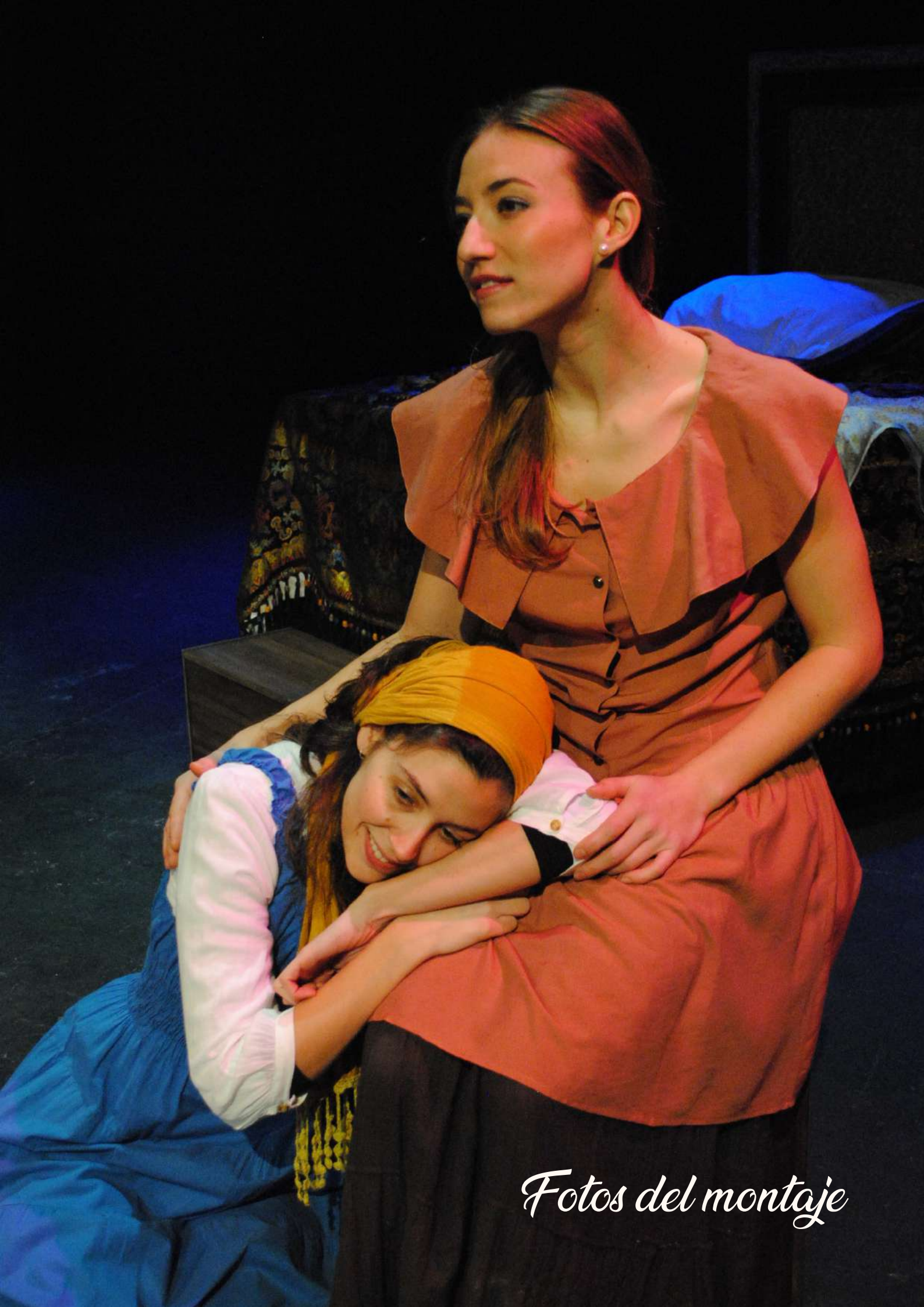
Fotos del montaje